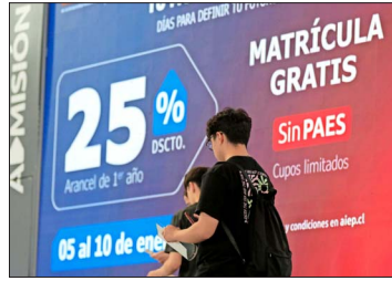
La gratuidad se otorga a quienes acrediten pertenecer al 60% más vulnerable de la población. Más de 625 mil personas estudian hoy con el beneficio.

Ninguno de estos factores determina por sí solo una inconsistencia: es su combinación lo que permite identificar casos que merecen una revisión más detallada.