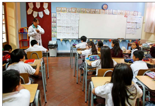
Según los directores, los colegios encaran desafíos que van más allá de los contenidos pedagógicos o incluso de la violencia que afecta a parte del sistema.