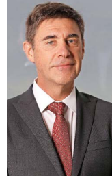
Manfred Paulmann, presidente de Cencosud.

La nueva hoja de ruta de Manfred Paulmann al mando de Cencosud B 8