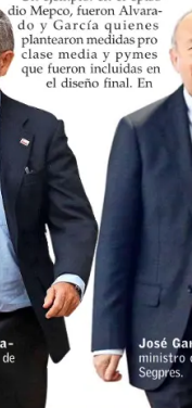
José García, ministro de la Segpres.