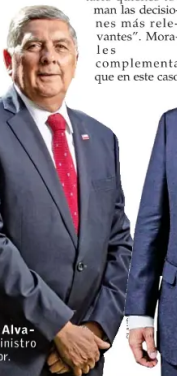
Arturo Squella, presidente del Partido Republicano.