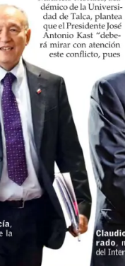
Claudio Alvarado, ministro del Interior.