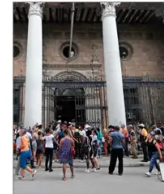
A la falta de electricidad y combustible en Cuba se suma la escasez de efectivo en los bancos, como lo atestiguan las largas colas, principalmente de personas mayores, que por horas se agolpan ante las sucursales. | A 6

> La rectora Rosa Devés advierte sobre la polarización, "que tiende a reducir al otro a un adversario antes que a un interlocutor legítimo. Esta dinámica se expresa en la radicalización del debate público y en una progresiva pérdida de la escucha". | C 1