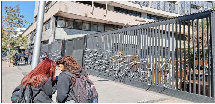
Tres colegios de Santiago fueron tomados ayer por alumnos, entre ellos el Instituto Nacional. Sin embargo, fueron desocupados durante la misma jornada.

El organismo detectó que escolares sancionados mantienen matrícula vigente en el mismo establecimiento del cual fueron removidos o en otros recintos tradicionales.