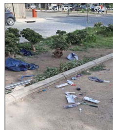
RIESGOS.— Habitantes alertan del riesgo sanitario de los desechos.