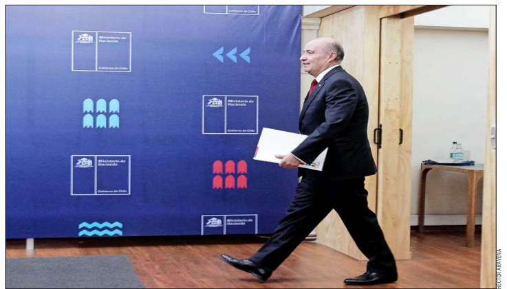
El ministro de Hacienda, Jorge Quiroz, destacó la gradualidad en la propuesta de reintegración del sistema.

tributaria del Colegio de Contadores, Juan Alberto Pizarro, apoyó la idea. “La reintegración total del régimen de impuesto renta es una medida clave para una mayor eficiencia y simplicidad de nuestro sistema tributario. Al eliminar la restitución parcial del crédito de impuesto de primera categoría, removemos una distorsión que hoy castiga a casi 100.000 pymes forzadas a tributar como grandes empresas”, asegura.