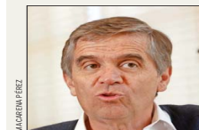
Rodrigo Vergara fue presidente del Banco Central.

El expresidente del Banco Central e investigador sénior del Centro de Estudios Públicos (CEP), Rodrigo Vergara, advirtió ayer que "es muy difícil que llegue a ser un buen año económico" el 2026. Cree que "lo mejor que se puede esperar" es que "en la segunda mitad del año la economía empiece a repuntar", con un mejor desempeño en 2027, expuso en el marco del programa Momento Económico del CEP.