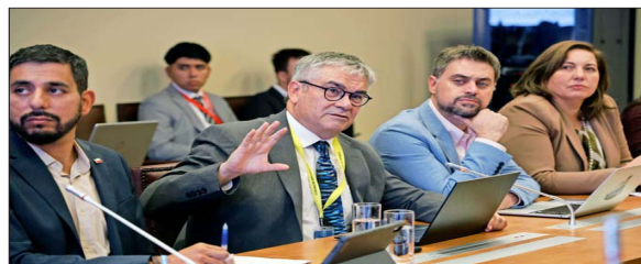
Mario Marcel ayer escuchó como invitado a la comisión de Hacienda de la Cámara de Diputados.

"La caja no le importa a nadie, excepto a los países que no tienen acceso al mercado crediticio", dijo el economista. El diputado Romero mantuvo críticas.