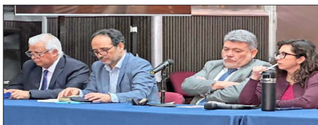
Los parlamentarios de oposición alertaron sobre el mayor costo para las familias que han tenido por las alzas de los combustibles.

Mientras el Gobierno se apronta al diálogo, las pymes alertan sobre los costos del reajuste salarial en el empleo formal.