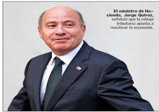
El ministro de Hacienda, Jorge Quiroz, enfatizó que la rebaja tributaria apunta a reactivar la economía.

Desde el Ejecutivo, el ministro de Hacienda, Jorge Quiroz, pidió no hacer "la típica caricatura que cualquier baja de impuesto es para fa-