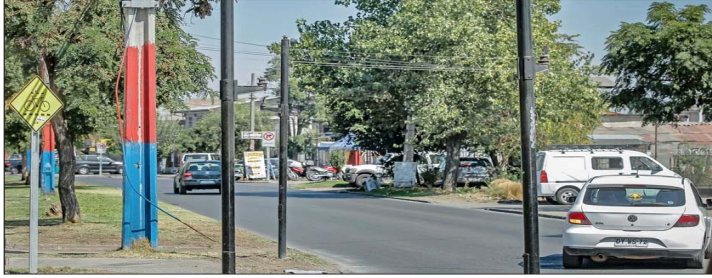
En Villa Francia, Estación Central, las autoridades ordenaron el retiro de semáforos. Se trata de una medida preventiva en contra de actos de vandalismo.

El estudio de riesgos incluye el foco en la delincuencia común que, aseguran, aprovecha estas fechas para cometer delitos como saqueos y narcotráfico. Se identificaron puntos críticos en la Región Metropolitana donde se instalarán piquetes con 15 funcionarios cada uno, con apoyo de vehículos tácticos.