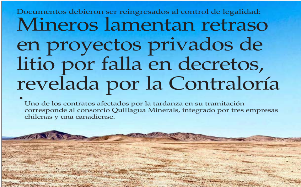
El CEOL que solicitó Quillagua Minerals abarca 40.975 hectáreas en el sector de Quillagua Este.