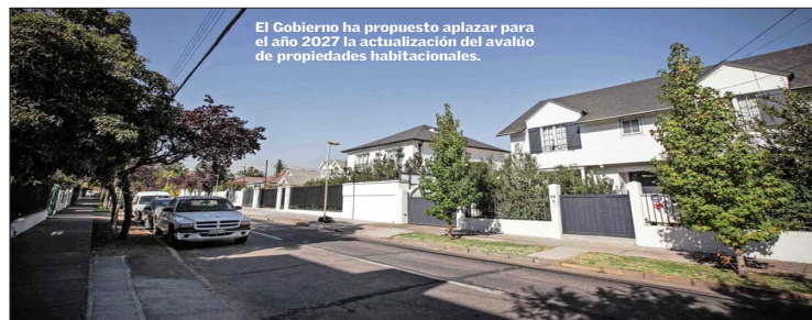
El Gobierno ha propuesto aplazar para el año 2027 la actualización del avalúo de propiedades habitacionales.

Un primer caso que se ventila es una contienda que enfrenta al SII con la Fundación Hospital Párron de San Bernardo. La institución de salud reclama por ser supuestamente contrario a la Constitución el artículo 1, letra B, de la Ley sobre Impuesto Terri-