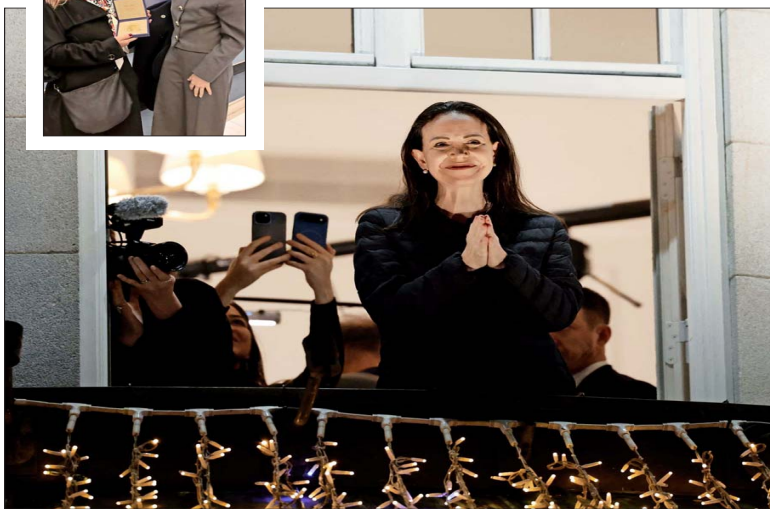
La líder de la disidencia venezolana, María Corina Machado, al salir anoche al balcón del Grand Hotel de Oslo. En su primera aparición pública tras meses en la clandestinidad, saludó a sus partidarios y cantó el himno de su país con la mano en el pecho.

Magdalena Piñera, desde la ceremonia en Noruega: Este es un reconocimiento a una mujer que ha dedicado su vida a la lucha contra la dictadura”.