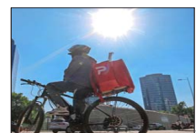
Riesgos del delivery : Días de 30 °C encienden alerta sobre la cadena de frío en reparto de comida. | C 7

Panel Ciudadano UDD: ¿Quién ganó el último debate? El 45% cree que Kast y el 34%, Jara | C 3