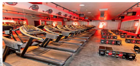
Smart Fit continúa desarrollando un ecosistema que busca acercar el movimiento y la actividad física a más personas en Chile.