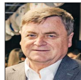
Hernán de Solminihaç, exministro de OO.PP.