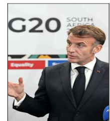
El mandatario francés, Emmanuel Macron, señaló que el grupo podría estar ante el “final de un ciclo”.

➤ Expertos señalan que existen intereses extranjeros y que las raíces del chavismo están en todo el aparato institucional. | A4