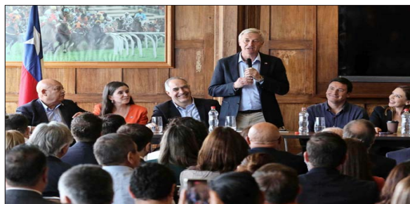
El abanderado José Antonio Kast sostuvo un encuentro con parlamentarios y militantes de partidos de oposición en el Sporting Club de Viña del Mar.

Jara afirma que embajador de EE.UU. invitó a candidatos a reunirse, en medio de tensión con La Moneda. | C8