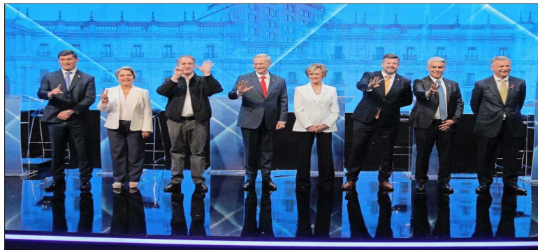
El programa se extendió por dos horas y media, contó con dos moderadores, y estuvo interrumpido por la franja electoral.

LAS CLAVES DEL SEGUNDO TIEMPO DEL MANDATO | A 4