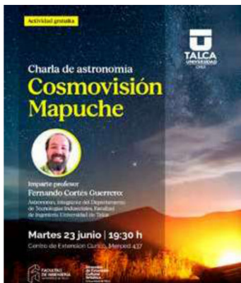
Este martes 23 de junio se presenta la Charla de Astronomía Cosmovisión Mapuche.