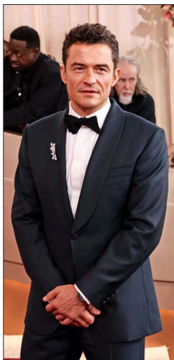
Orlando Bloom en la pasada gala de los Globos de Oro. Pronto estrenará la nueva película de Werner Herzog.

De hecho, "Deep cover" es su más reciente estreno, una comedia sobre un grupo de actores fichados por la policía londinense. Además, aún espera estrenar otra comedia, "Wizards", de David Michôd ("Reino animal"), donde actúa junto a Pete Davison y Naomi Scott. También, el año pasado rodó "Bucking fastard", de Werner Herzog, un drama prota-