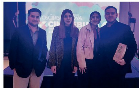
LOS REALIZADORES RECIBIENDO EL PREMIO EN LEBU.

industria está allá, pero en regiones hay mucho talento", explicó.