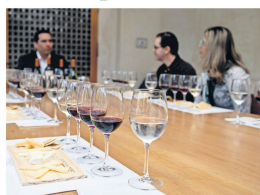
El enoturismo ha sido una estrategia para contrarrestar la caída en las ventas.

Restoranes, cafeterías y centros de eventos en Santiago han incorporado en su carta vinos y tragos sin alcohol, junto con organizar "fiestas de café", orientadas a la generación Z, los nacidos entre 1996 y 2009 que, se dice, toman menos alcohol. Esto podría obedecer a una nueva generación de psicofármacos que impide la ingesta, aunque una académica de la Universidad de Talca apuntó al reemplazo del vino por la cerveza. La tendencia es mundial. El consumo mundial de vino el año pasado alcanzó los 20.800 millones de litros, lo que supone su nivel más bajo desde 1957 y refleja una caída acumulada de 14% desde 2018, según la Organización Internacional de la Viña y el Vino (OIV). En Chile, la producción bajó 10% en 2025, mientras que la superficie cubierta por viñas se ha reducido un 27% desde 2019, indicó a agencia EFE el Servicio Agrícola y Ganadero (SAG). A esto se añade que las exportaciones arrancaron 2026 con un retroce-