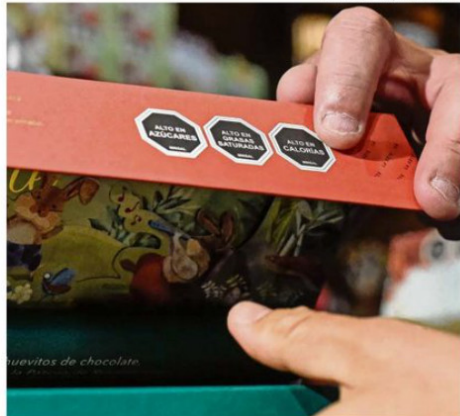
LOS SELLOS PERMITEN SELECCIONAR CONSCIENTEMENTE LA COMIDA.