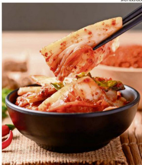
EL KIMCHI ES PARIENTE DEL CHUCRUT.

Esta bacteria característica de los chucrut "estabiliza la fermentación y, según la