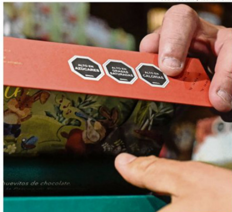
LOS SELLOS PERMITEN SELECCIONAR CONSCIENTEMENTE LA COMIDA.