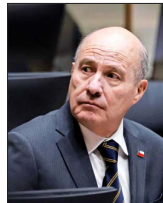
El ministro de Hacienda, Jorge Quiroz, precisó ayer que el proyecto que aumenta el techo de la deuda ingresará este miércoles al Parlamento.