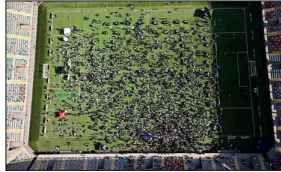
Para llenar el álbum completo, es necesario reunir 980 láminas. Las más buscadas corresponden a Lionel Messi y Cristiano Ronaldo.

Con el sueño de lograr juntar las 980 láminas de las 48 selecciones participantes del Mundial 2026, más de 8 mil personas llegaron ayer hasta el Estadio Bicentenario de La Florida para participar en la denominada "Gran Cambiatori" del álbum futbolero.