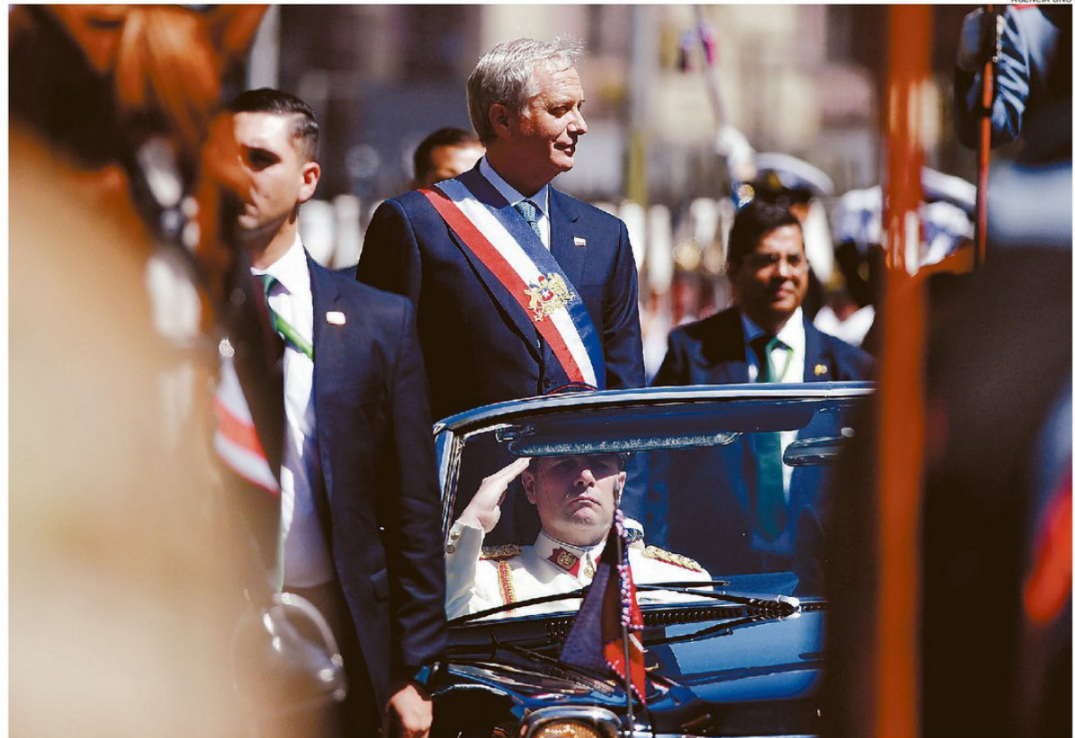
DESDE SOSTENER EL MENSAJE DE CAMPAÑA HASTA RECONOCER ERRORES SON ALGUNAS DE LAS TEMÁTICAS QUE PODRÍAN ABORDARSE EN ESTA PRIMERA CUENTA PÚBLICA DE KAST.

En el caso del segundo gobierno de Sebastián Piñera, recuerda el académico, "la atención estuvo puesta en torno a las diferencias con los logros alcanzados por Michelle Bachelet y la preocupación sobre la situación económica. Por su parte, Gabriel Boric orientó su discurso a las demandas expresadas en el estallido social y las esperanzas que despertaba el pri-