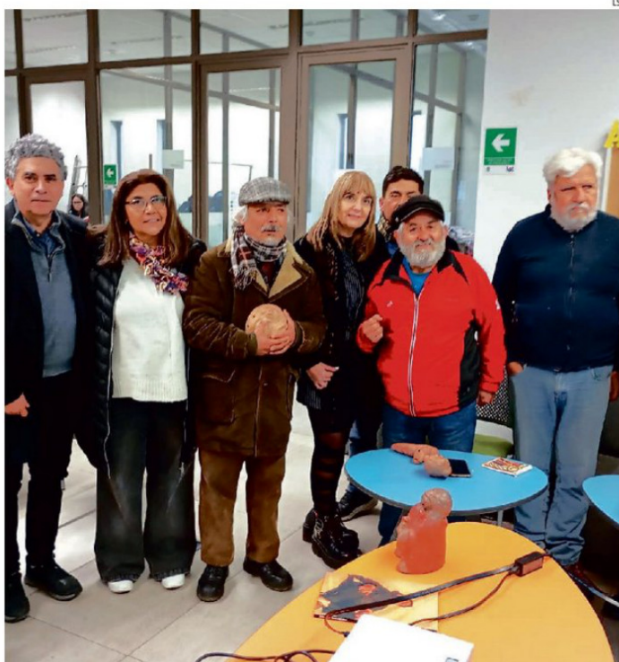
DESTACADO CERAMISTA ESTUVO EN SAN ANTONIO EXPONRIENDO SOBRE SU ARTE.

"Venir a aportar con la cerámica ha sido muy importante y estamos echando a andar esta carrera que nos ayuda a todos cul-