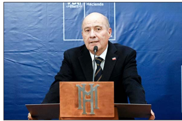
El ministro de Hacienda, Jorge Quiroz, ayer realizó una conferencia de prensa para alertar sobre el nuevo escenario fiscal.

En específico, Quiroz denunció que el IFP del cuarto trimestre de 2025 —que elaboró el equipo del anterior titular de Hacienda, Nicolás Grau— contenía un error de consistencia de 2,9% del PIB en la trayectoria de deuda futura. En el Informe se explica que el desequilibrio proyectado de las cuentas públicas acumulaba un deterioro de $13,5 billones entre 2026 y 2030, pero la cifra de endeudamiento solo aumentaba en