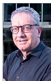
Bernardo Fontaine presidirá Codelco desde mañana miércoles 27.

Pacheco manifestó en la carta que “como chileno, agradezco la oportunidad que tuvo de servir al país desde esta posición. He puesto al servicio de esta tarea toda mi energía, mis capacidades y mi experiencia empresarial y pública. Nunca, nada, me apartó de la responsabilidad que significa ser presidente de la mayor empresa del Estado de Chile, que ha aportado desde su fundación en 1971 la cantidad de US$ 164.000 millones (en moneda actual) al erario nacional, y cuenta con más de 75.000 trabajadores, la seguridad de los trabajadores, la transparencia y el buen uso de los recursos públicos, que se traduzca en un mayor aporte al Estado y los chilenos. ¡Codelco puede más!”.