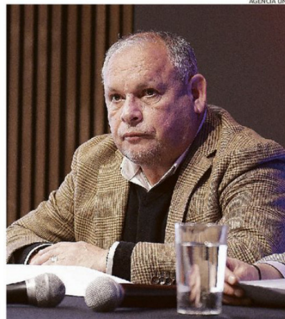
MUNDACA DEFINIÓ AL MOVIMIENTO COMO UN ESPACIO "SINCRÉTICO".

Con una lectura que apunta también al escenario de fragmentación en las izquierdas, el director de la Escuela de Ciencia