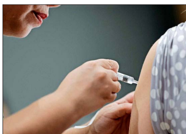
Pasarán años hasta tener una vacuna contra el Andes Virus, aseguran los investigadores. En el país aún no se han probado inoculaciones en humanos.