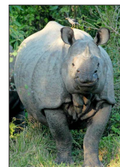
El rinoceronte nepalí pasó de apenas 100 ejemplares en los años 60 a un récord de 752 en 2021.

La farmacéutica Moderna anunció que trabaja en una vacuna para los hantavirus (en general) en coordinación con el Instituto de Investigación Médica del Ejército de EE.UU. para enfermedades infecciosas. Las acciones de Moderna subieron la semana pasada.