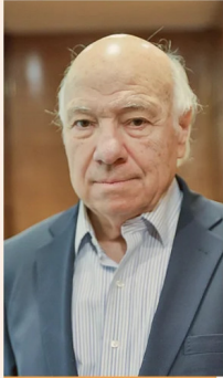
VITTORIO CORBO, EXPRESIDENTE DEL BANCO CENTRAL.

“No hay evidencia respecto de su impacto en el crecimiento; rigidiza las políticas tributarias”.