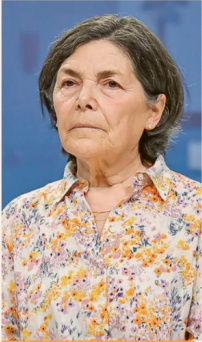
PAULINA SABALL, EXMINISTRA DE ESTADO.

“No hay evidencia respecto de su impacto en el crecimiento; rigidiza las políticas tributarias”.