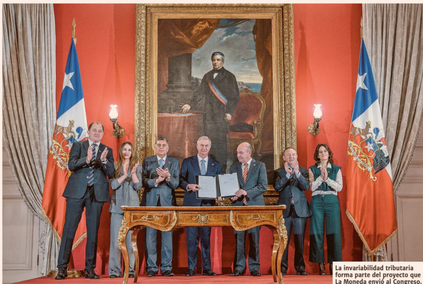
La invariabilidad tributaria forma parte del proyecto que La Moneda envió al Congreso.

riabilidad tributaria y los de derecha más a favor".