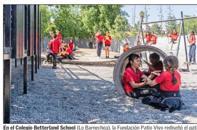
En el Colegio Betterland School (La Barnechea), la Fundación Patio Vivo diseñó el patio con estrategias de juego y naturaleza. Se han reportado mejoras en convivencia e inclusión.