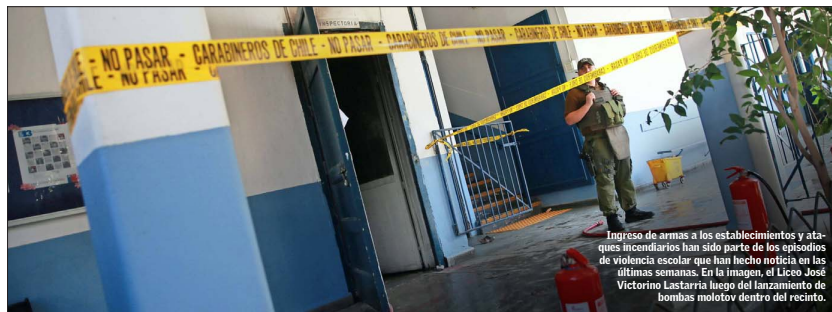
Ingreso de armas a los establecimientos y ataques incendiarios han sido parte de los episodios de violencia escolar que han hecho noticia en las últimas semanas. En la imagen, el Liceo José Victorino Lastarria luego del lanzamiento de bombas molotov dentro del recinto.

Coinciden en la actual falta de herramientas y la sobrecarga de las comunidades. Unos advierten límites en las medidas centradas en control y otros enfatizan la urgencia de fortalecer la prevención desde las primeras etapas.