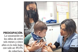
PREOCUPACIÓN. La vacunación en los niños de entre seis meses y cinco años es la más baja, con solo un 49,4% de cobertura.

"No hay que olvidar que en Salud la gran tarea que tenemos es la utilización eficiente de los recursos, y si esto no se resuelve, el problema de fondo no se va a solucionar", plantea. Añade que "hay espacios muy importantes para aumentar la eficiencia: no puede ser que tengamos una persona con 3 años en sumario y que sigue recibiendo el sueldo".