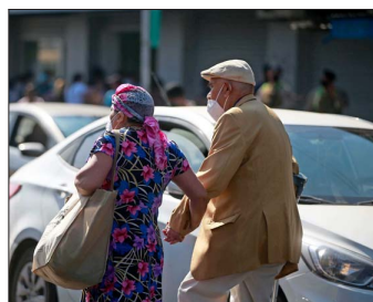
ANÁLISIS.— El estudio destaca que las tareas de cuidado recaen principalmente en mujeres, especialmente de mayor edad.

Al desagregar por sexo, la brecha se profundiza. Un 26,5% de las mujeres inactivas menciona el cuidado de otros como motivo para no trabajar, frente a solo un 10% de los hombres. Una tendencia similar se observa en los