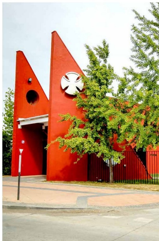
Desde Teletón Maule, la invitación es a seguir fomentando la lectura y tomar un libro no solo este día, sino durante todo el año, pues leer estimula la imaginación y abre conversaciones.