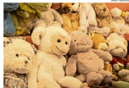
ENTRE 10% Y 15% MÁS ESTÁ COSTANDO FABRICAR MUÑECOS.