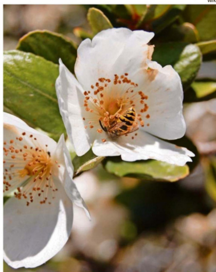
LA FLOR DEL ULMO ES RECONOCIDA POR SU AROMA DULCE.

trospinning o electrohilado, técnica que permite fabricar nanofibras, es decir, hilos con un diámetro menor a 500 nanómetros, lo que equivale a 0,0005 centímetros. Para tener en