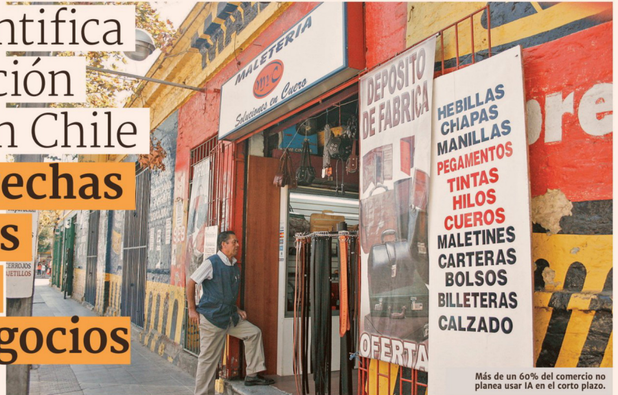
Más de un 60% del comercio no planea usar IA en el corto plazo.

■ Un estudio de la CNC observó que más de un 60% de las empresas de mayor tamaño tiene un nivel de digitalización alto, mientras que en las micro no supera el 40%. Lo mismo ocurre con el uso de IA y el acceso a tecnología.