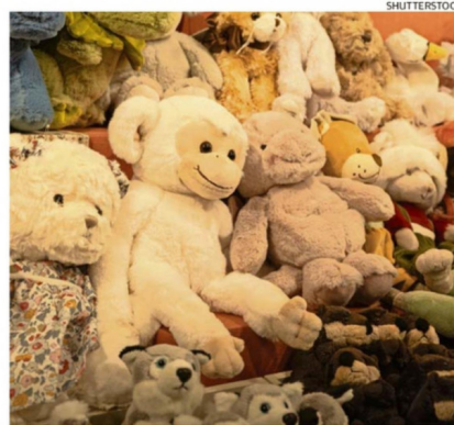
ENTRE 10% Y 15% MÁS ESTÁ COSTANDO FABRICAR MUÑECOS.