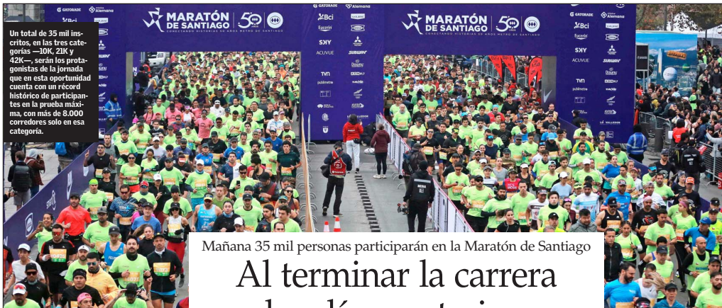
Un total de 35 mil inscritos, en las tres categorías —10K, 21K y 42K—, serán los protagonistas de la jornada que en esta oportunidad cuenta con un récord histórico de participantes en la prueba máxima, con más de 8.000 corredores solo en esa categoría.

SANTIAGO DE CHILE, SÁBADO 25 DE ABRIL DE 2026