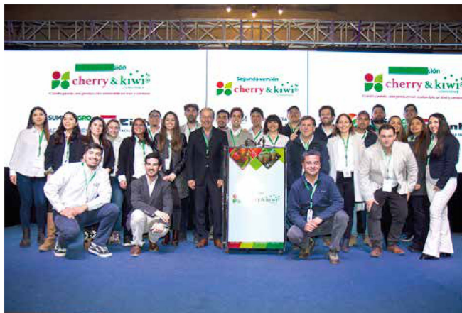
La edición anterior convocó a cerca de 400 productores, asesores y empresas del sector, reflejando el creciente interés de la industria por espacios de análisis técnico y actualización.

CURICÓ. Tras el éxito de sus versiones anteriores, Cherry & Kiwi Conference realizará su tercera versión el próximo 20 de agosto de 2026 en Casona Verona, ubicada en Curicó, Región del Maule. El evento es organizado por el Centro de Innovación Montefrutal (CIM) de Abud & Cia. y busca reunir nuevamente a productores, asesores técnicos, inversionistas y empresas proveedoras en una jornada de análisis, aprendizaje y networking. Durante el encuentro, especialistas nacionales e internacionales compartirán informa-