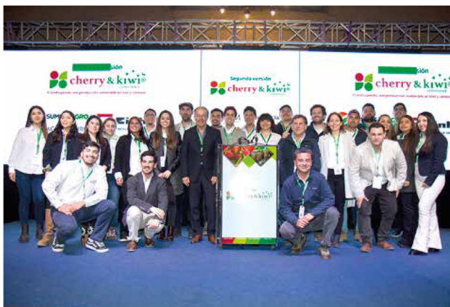
La edición anterior convocó a cerca de 400 productores, asesores y empresas del sector, reflejando el creciente interés de la industria por espacios de análisis técnico y actualización.

CURICÓ. Tras el éxito de sus versiones anteriores, Cherry & Kiwi Conference realizará su tercera versión el próximo 20 de agosto de 2026 en Casona Verona, ubicada en Curicó, Región del Maule. El evento es organizado por el Centro de Innovación Montefrutal (CIM) de Abud & Cia. y busca reunir nuevamente a productores, asesores técnicos, inversionistas y empresas proveedoras en una jornada de análisis, aprendizaje y networking. Durante el encuentro, especialistas nacionales e internacionales compartirán informa-