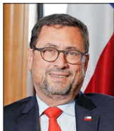
Francisco Pérez Mackenna, canciller.