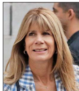
Ximena Rincón, ministra de Energía.

Según declaraciones de patrimonio en intereses: