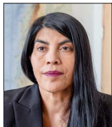
Ximena Lincolao, ministra de Ciencia.

El jefe de la cartera de Relaciones Exteriores anotó 19 participaciones en el ítem de comunidades, sociedades y empresas. También incluyó cuatro cuotas