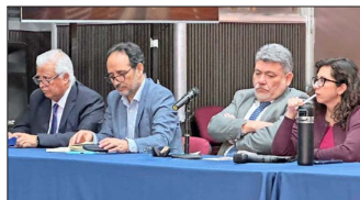
Los parlamentarios de oposición alertaron sobre el mayor costo para las familias que han tenido por las alzas de los combustibles.

Mientras el Gobierno se apronta al diálogo, las pymes alertan sobre los costos del reajuste salarial en el empleo formal.