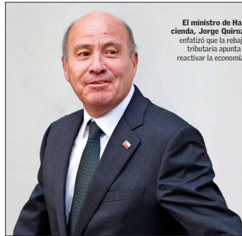
El ministro de Hacienda, Jorge Quiroga, enfatizó que la rebaja tributaria apunta a reactivar la economía.

Desde el Ejecutivo, el ministro de Hacienda, Jorge Quiroga, pidió no hacer "la típica caricatura que cualquier baja de impuesto es para fa-