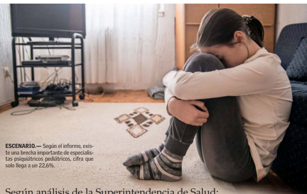
ESCENARIO.— Según el informe, existe una brecha importante de especialistas psiquiátricos pediátricos, cifra que solo llega a un 22,6%.

El informe indica que si bien en el sistema privado no se observa una demanda creciente de atención, esto no implica la disminución de la prevalencia "si no más bien puede ser indicativo de una atención de personas por debajo de las necesidades, pero por diversos motivos (gasto de bolsillo, estigma, falta de oferta) las personas que la necesitan no están accediendo a ella".