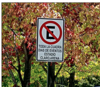
VEHICULOS.—Vecinos de la zona reclaman por la gran aglomeración de automóviles que ocurre en las cercanías al estadio durante cada evento.

El historial de estos encuentros reactiva temores por congestión, seguridad y alteraciones en la vida del barrio. Residentes definen el estadio como "un vecino molesto".