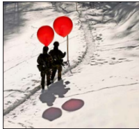
Soldados recorrieron las inmediaciones del encuentro en Davos llevando globos rojos.

Chile con personas que tienen inversiones en nuestro país, y otros que prestan servicios profesionales a los empresarios criollos y sus empresas en la región. Hay varios motivos para estar orgullosos de nuestro país y para estar optimistas sobre el futuro. En primer lugar, Chile es todavía percibido como la nación con la estructura institucional más estable y fiable para hacer inversiones en todo el continente latinoamericano. Y en segundo lugar, se le reconoce a nuestro país el tener una sociedad con un nivel de educación y capacidades que está muy por encima de las otras países. De hecho, esta gente ya no asocia a Chile con las realidades político-económicas que son típicas (en el sentido negativo) de la noción de América Latina.