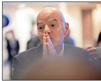
El presidente de la Fifa, Gianni Infantini, apareció ayer en la cumbre.

Aprovecho para compartir el haber tenido la oportunidad de conversar sobre