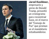
Jared Kushner, empresario y yerno de Donald Trump, presentó un cronograma para reconstruir Gaza, en el marco del “Consejo de Paz” que promueve el mandatario estadounidense.