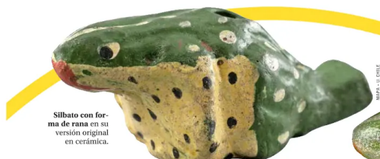
Silbato con forma de rana en su versión original en cerámica.