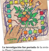
La investigación fue portada de la revista Plant Communications .