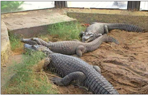
Los típicos yacarés del Parque Temático de Cavancha iniciaron su traslado a distintos lugares del país.

bos caimanes llegaron sin inconvenientes desde Tarapacá: “Y hoy estamos terminando la remodelación del zoológico y esperamos que a fin de año el público ya pueda disfrutar de estas yacarés”.