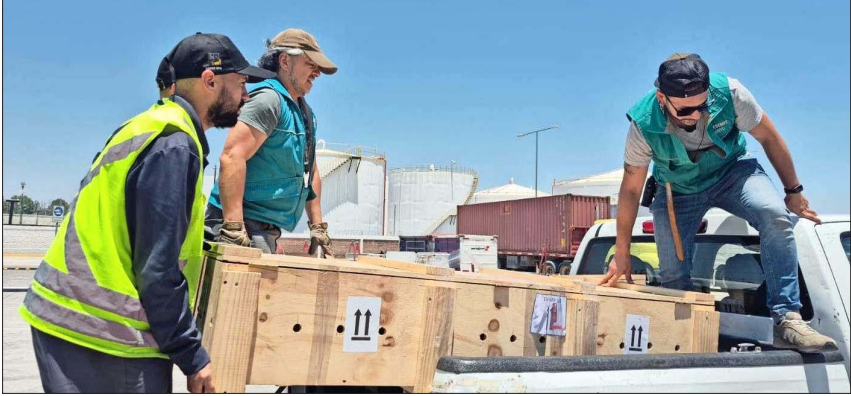
Los yacarés llegaron sin problemas al zoológico de Santiago, y se espera que los próximos días el público los pueda ver.