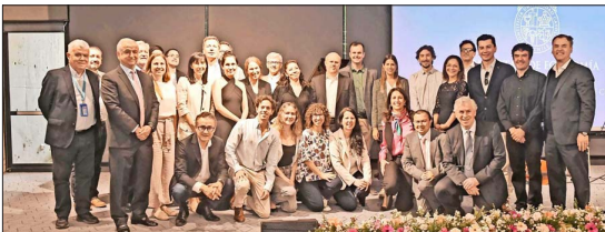
Académicos de la Facultad de Economía y Administración UC.