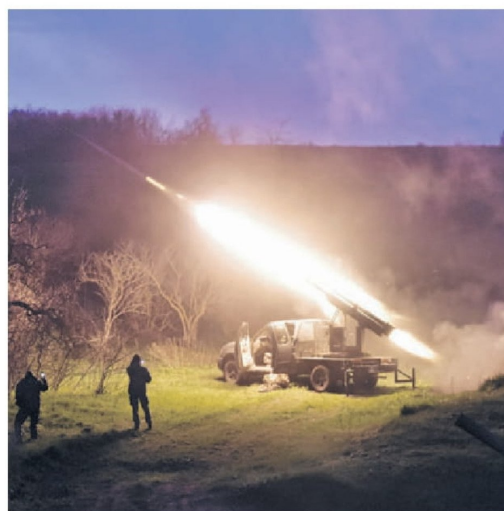
► Militares ucranianos disparan un MLRS en la región de Zaporizhzhia.

Este es probablemente el aspecto más difícil, porque si la garantía no se implementa de forma creíble, no es una garantía. No se puede confiar en ella. Espero que sepan que esto ocurrirá al final del proceso, y que las cosas se equilibrarán, y que el entorno será diferente cuando lleguemos a eso. El gobierno de Estados Unidos ha dicho indirectamente que si entablan relaciones económicas con Ucrania, su presencia allí va a disuadir a los rusos, porque somos nosotros (Estados Unidos). Me pregunto si basta con que rusos y estadounidenses sean amigos y colaboren. ¿Qué tipo de disuasión es esa? Hay muchos aspectos que deben resolverse para alcanzar esa etapa de garantías de seguridad. Según mi propia experiencia, una garantía es una botella bonita en un estante. Lo miras, dices que la garantía está ahí, pero no quieres abrirla y ver que está vacío. No quieren esa sorpresa. ●