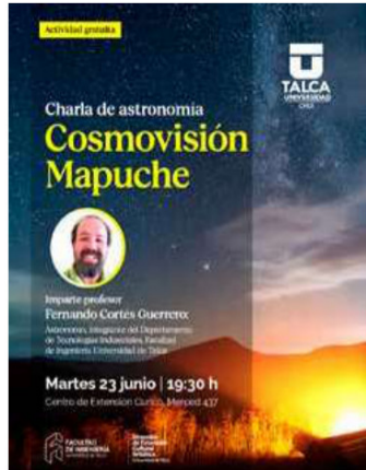
Este martes 23 de junio se presenta la Charla de Astronomía Cosmovisión Mapuche.