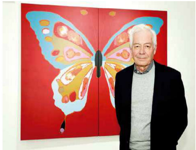
La exposición “Metamorfosis” se encuentra abierta de manera gratuita a toda la comunidad en el Centro de Extensión de la Universidad de Talca en Santiago, ubicado en Quebec 415, esquina Condell, Providencia.

• La muestra denominada “Metamorfosis” llegó a la capital tras su exitoso paso por la Región del Maule.