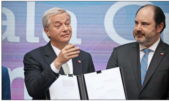
El Presidente José Antonio Kast y el ministro del Trabajo, Tomás Rau, firmaron ayer las indicaciones al proyecto de sala cuna.