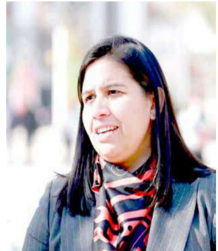
Presidenta de RN, Andrea Balladares, espera que caso no afecte la labor legislativa.

"Si la acusación se lleva con altura de mira, con mucha responsabilidad y con el sustento que corresponde a una herramienta de este nivel, la verdad es que en ese tono se puede lograr generar ambas cosas, con mucha conversación, con un desafío mayor, pero creo