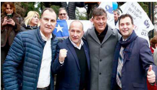
Diputado Guillermo Valdés junto a Franco Parisi, líder del Partido de la Gente y tercer mejor evaluado en encuesta CEP.

Agregó que "Franco (Parisi) ha logrado interpretar las preocupaciones de la clase media y la clase media emergente, que muchas veces sienten que sus problemas no son escuchados".